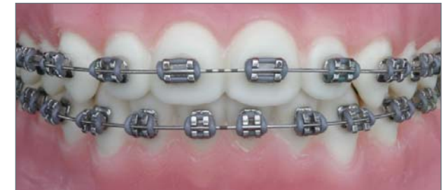
Normale Metall-Brackets sind beim Lächeln mehr zu sehen.