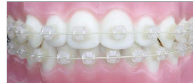
Mit PLUS Brackets sind Sie alles was man sieht.

Zeigen Sie Ihr Lächeln, nicht Ihre Brackets.